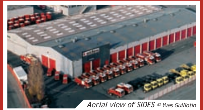
Aerial view of SIDES

SIDES is the top French fire fighting and emergency vehicle constructor.