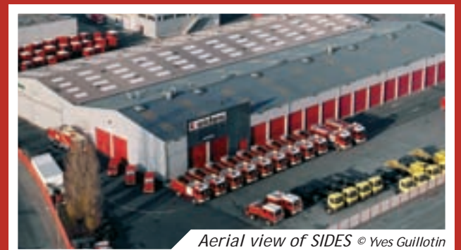
Aerial view of SIDES

SIDES is the top French fire fighting and emergency vehicle constructor.