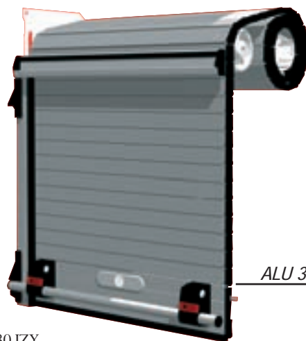
ALU 30 IZY

Lors de la commande, les côtes, l'encombrement, l'emplacement du rideau doivent être pris en compte pour élaborer le produit final. Le gain de temps repose entièrement sur l'intégration parfaite du rideau dans la carrosserie. Pour familiariser le client avec ces exigences, MCD met à la disposition des professionnels un technico-commercial, il explique les modalités et établit les recommandations, pour éviter tout incident à la première commande