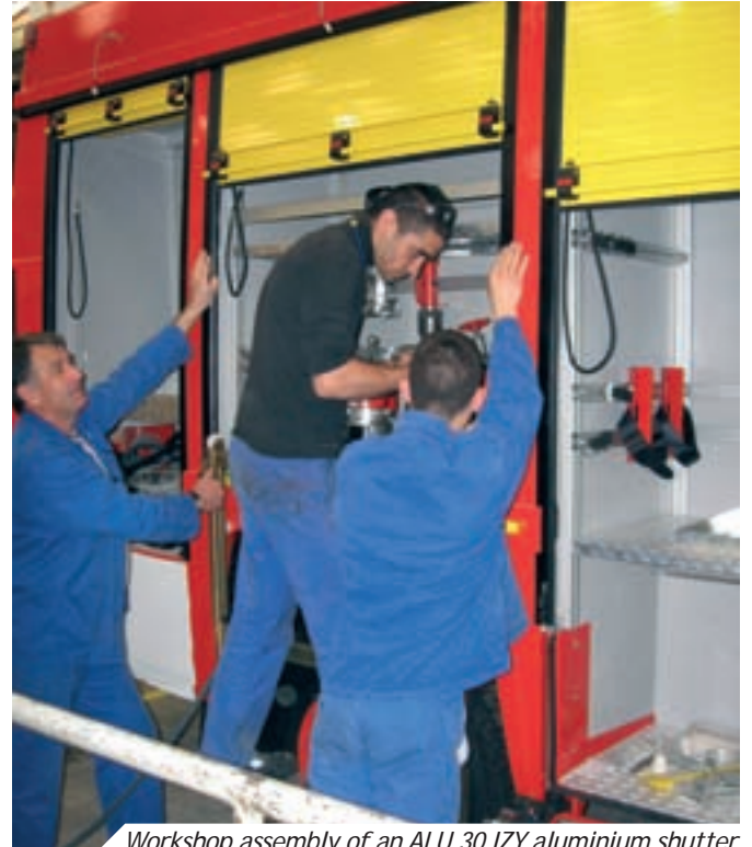
Workshop assembly of an ALU 30 IZY aluminium shutter