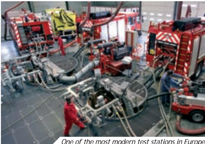
One of the most modern test stations in Europe

“ Our MCD purchases show a rise 10 % [...] ”