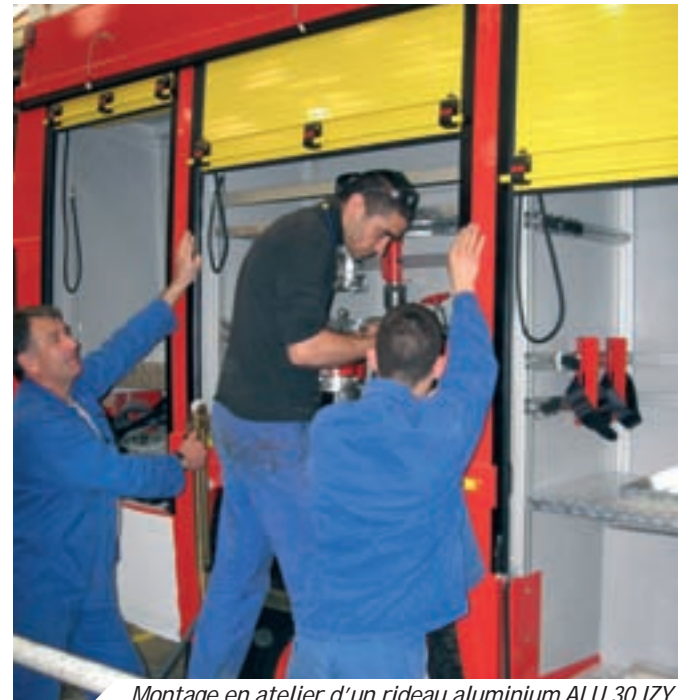
Montage en atelier d'un rideau aluminium ALU 30 IZY

utilisent un langage identique et vont dans la même direction ; un objectif commun : donner le meilleur d'eux-mêmes aux utilisateurs.