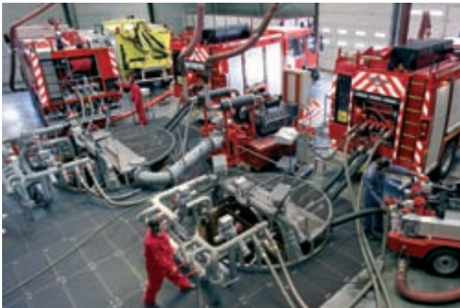
La station d'essais est l'une des plus modernes d'Europe