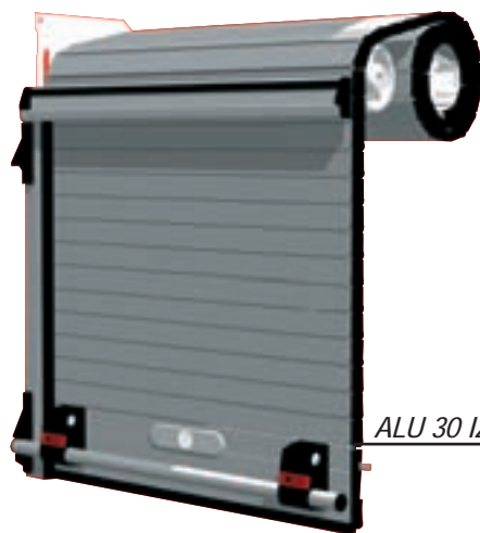
ALU 30 IZY shutter

This product requires integration sizes to be followed specifically. Data must be transmitted rigorously between the bodywork company and the constructor. During the order, the shutter sizes, blocking, fitting must be taken into account to produce the final product. The gain in time lies entirely in integrating the shutter perfectly into the bodywork. In order to familiarise the client with their requirements, MCD makes a technician-salesman available to professionals who can explain the modalities and establish recommendations, to avoid any incidents when first ordering the ALU 30 IZY shutter. Commercialised in 2006, ALU 30 IZY has an increasing