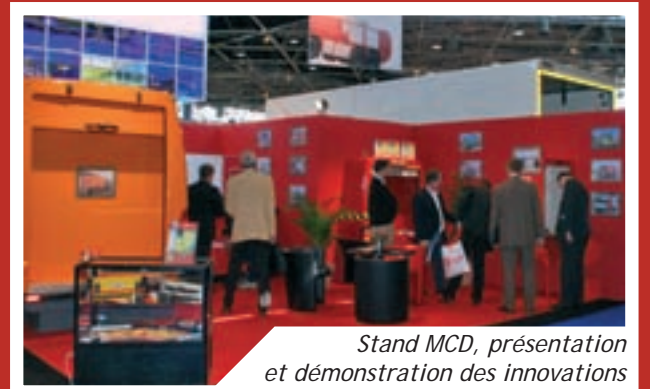
Stand MCD, présentation et démonstration des innovations

740 exposants, 25 pays, 70 000m 2 d'exposition.