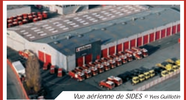
Vue aérienne de SIDES

La société SIDES est le premier constructeur français de véhicules de lutte contre l'incendie et de secours.