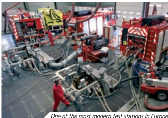
One of the most modern test stations in Europe

“ Our MCD purchases show a rise 10 % [...]”